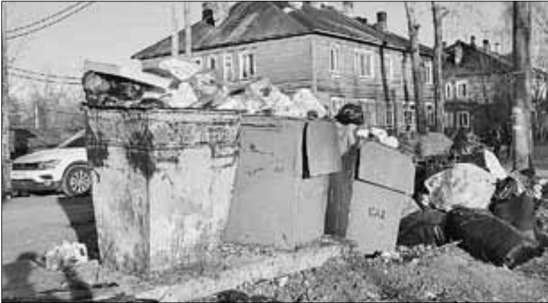
■ ул. Ярославская, 52

Общую картину в городе портят и «субботниковские» мешки с мусором