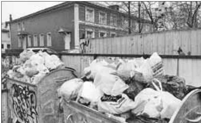
■ ул. По- морская, 13