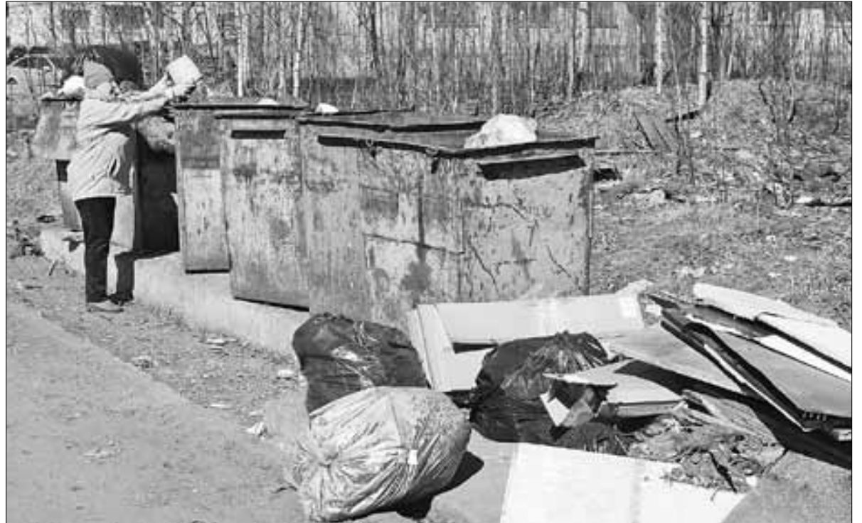
■ ул. Штурманская в районе домов №№ 1, 2, 3