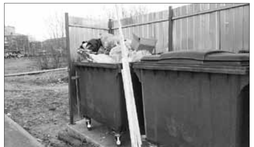
■ ул. Конзихинская, 11

А вот на улице Доковской, 34 регоператору и окружной администрации есть над чем поработать: площадка не оборудована, контейнеры стоят прямо на земле, не огорожены, а это вопиющее нарушение. Вообще, складывается впечатление, что этот адрес вообще остался сиротой: ни «ЭкоИнтегратор» сюда не заезжает, ни управляющая компания не работает, да и жильцы, просто говоря, «забили» на чистоту. Мало того что контейнеры переполнены, так и прилегающая к деревянной двухэтажке территория находится в плачевном состоянии. Мусор разносит ветром, и видно, что проблема появилась далеко