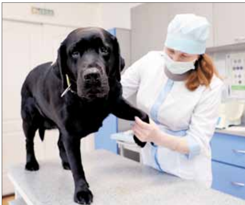
■ Главное, чтобы четвероногий друг понимал, что ему хотят помочь

вает такое, что вообще не удается сделать нужные манипуляции – ведь ваших пациентов на словах не убедишь, что это надо для их же пользы?