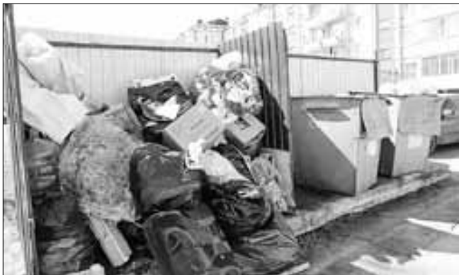
■ ул. Штурман- ская, 8