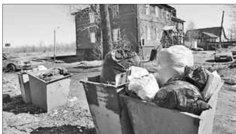
■ ул. Доковская, 34