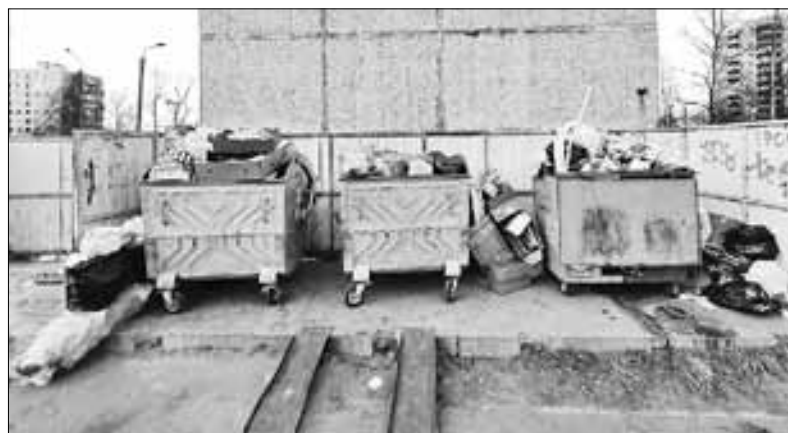
■ ул. Краснофлотская, 5